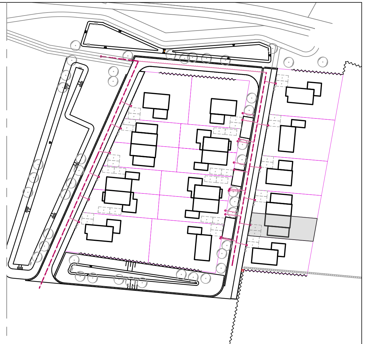
Overzicht situatie schaal 1:1000